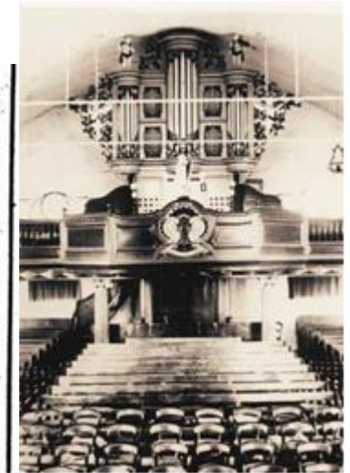
Kerk interieur voor 1951 het orgel met orgelschild