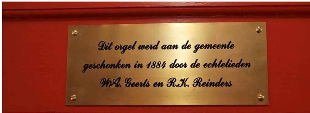
Het naambordje boven de speeltafel.

In februari 2018 is bij de viering van het 275 jarig bestaan een plaatje met de namen van de schenkers op het orgel aangebracht.