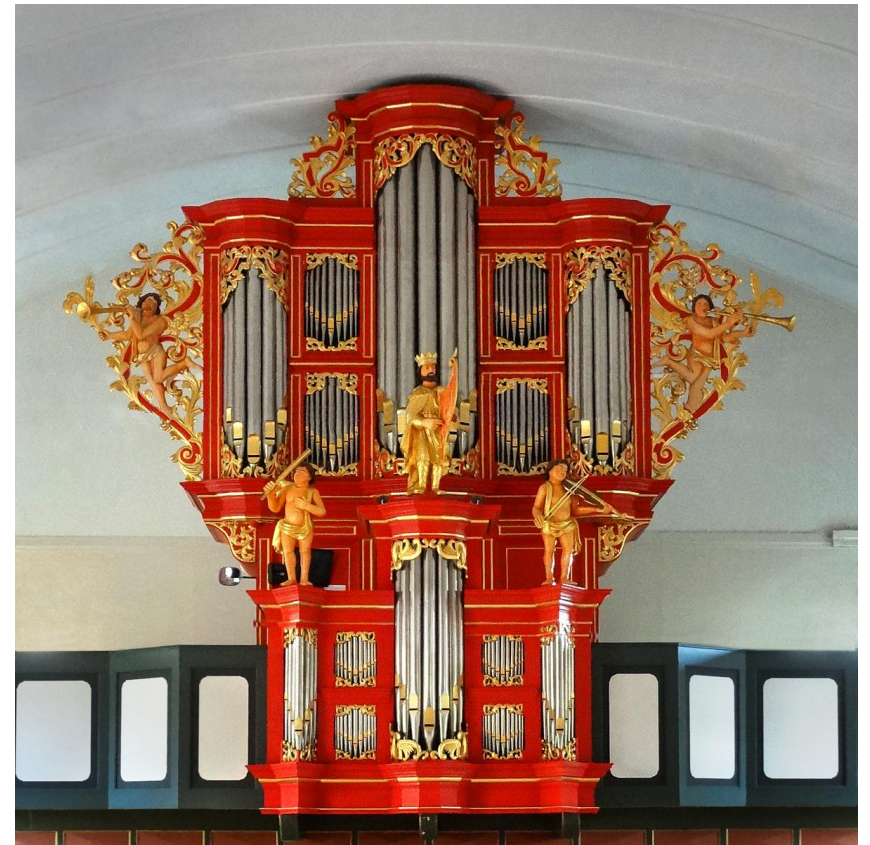
Het orgel in de huidige - 2018 - staat

De kerk van Berghuizen is in het bezit van een - voor een Gereformeerde kerk - monumentaal barok Amoor-orgel, een van de oudste orgels van Drenthe, een waardevol bezit.