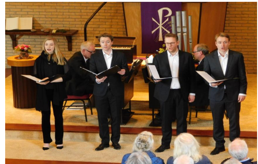
Ook hebben zij op twee kofferharmoniums een kwartet zangers begeleid bij het zingen van Folksongs en Hymnes.